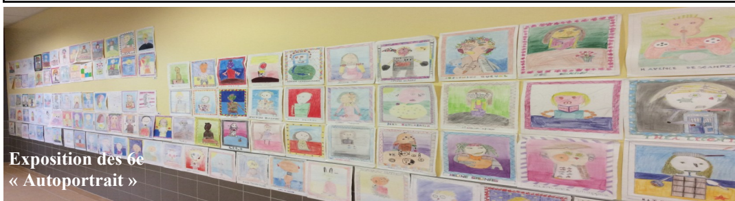
Exposition des 6e « Autoportrait »